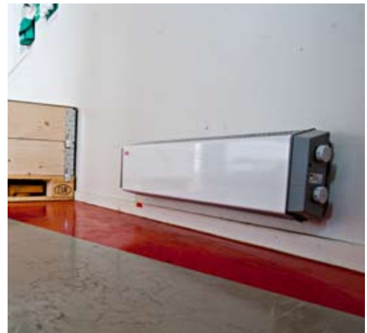
Приборы Thermowarm с передней панелью белого цвета могут выпускаться как с выключателем, так и без него.