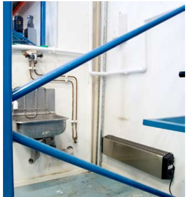
Имеется коррозионно-стойкое исполнение Thermowarm для помещений с повышенной влажностью.