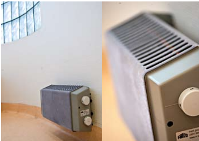
Приборы серии TWT200 имеют низкую температур поверхности, что дает возможность применять их, в частности, в детских учреждениях.