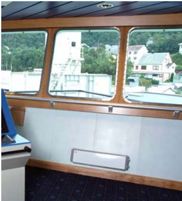
Компактные размеры и легкость установки дают возможность размещать прибор в ограниченных пространствах, например, в кабине управления.